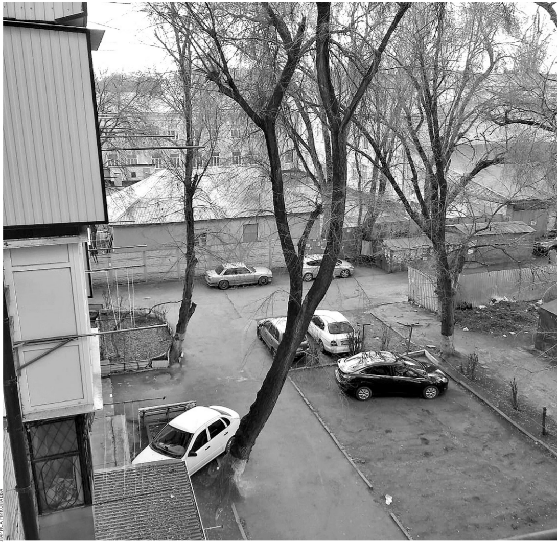
«Танцующее дерево» угрожает жизни и безопасности жильцов дома

Дошла! Но, увы, адресат снова не горит предпринять рекомендуемые действия. Видимо, не боясь административной ответственности и не переживая о судьбах жильцов.