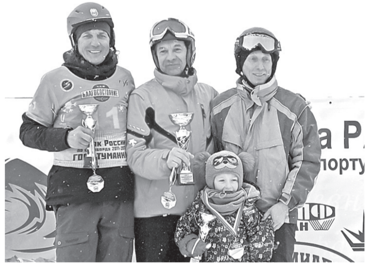
Второе место — у команды САО РАН

В городе Таштаголе Кемеровской области прошли соревнования по горнолыжному спорту и сноубордингу «Академиада-2022». Участниками стали 57 спортсменов-любителей и институтов Российской академии наук из Москвы, Красноярска, Нижнего Новгорода, Новосибирска, Томска... Карачаево-Черкесию представила команда САО РАН из Нижнего Архыза.