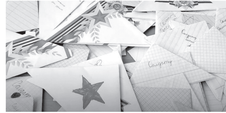
Письма российским военным

Как сообщает мэрия Черкесска, присоединиться к акции могут все желающие. Для этого необходимо принести письма с пожеланиями, детские рисунки или плакаты в пункты приема, которые будут работать во всех общественных приёмных «Единой России». Все послания партии доставит до мест несения боевой службы российских военных.