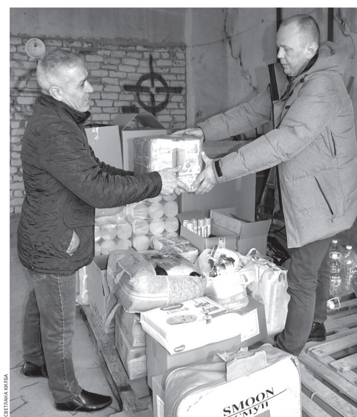
Груз готовится к отправке

Также в некоторых сетевых магазинах и супермаркетах были установлены специальные тележки, куда можно положить продукты и товары для бежен-