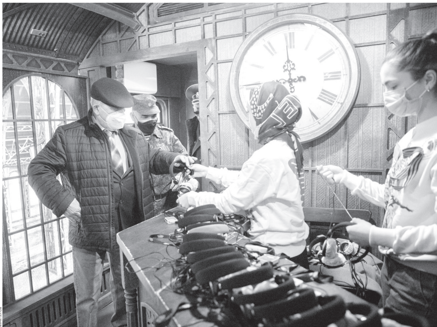
Волонтеры «Поезда Победы» помогли посетителям

Меня выбрали водить экскурсии. Поезд Победы очень интересный. Он представляет собой военную историю, которая показывает нам хронологию войны. Очень интересные иллюстрации — как живые. Поезд