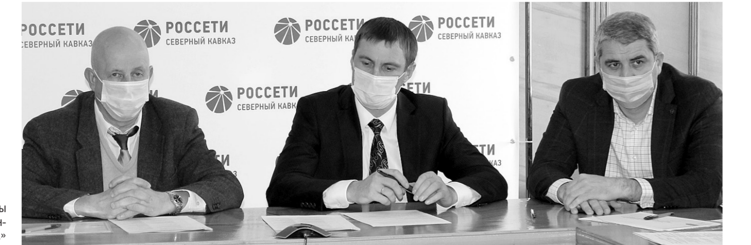
Заседание комитета по охране труда «Россети Северный Кавказ»