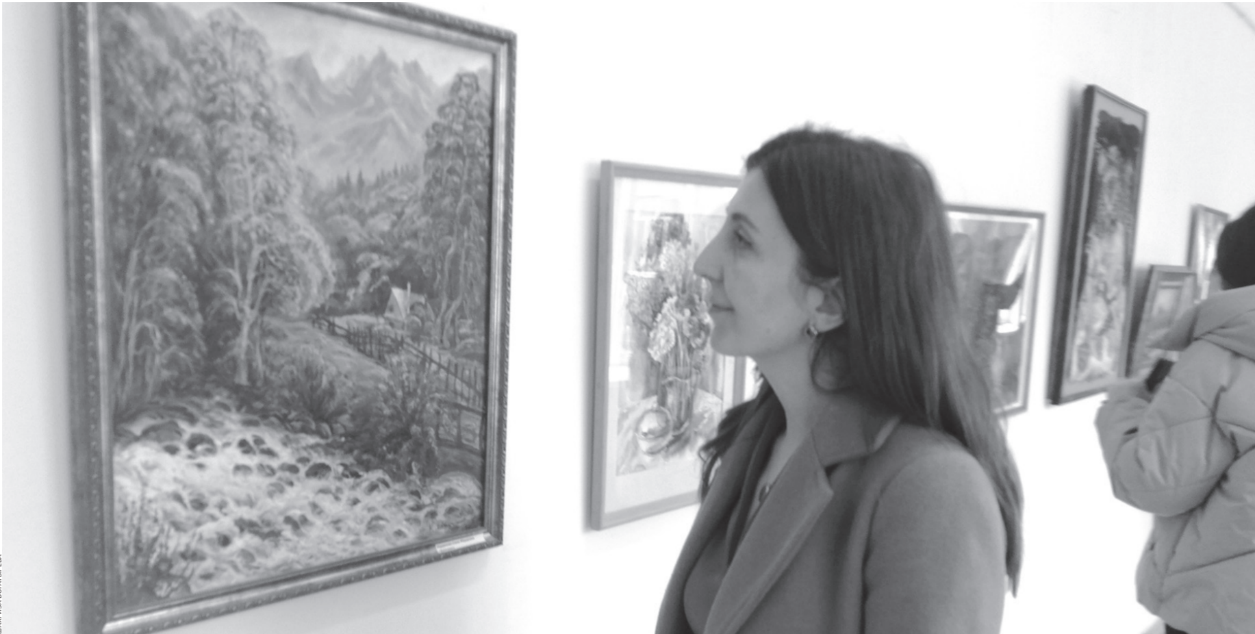
Любители живописи знакомятся с творчеством педагогов

Что до меня, то я давно заметила, что художники Карачаево-Черкесии в основном выбирают пейзажную лирику. Бытовая или батальная живопись редко встречаются. Портреты, натюр-