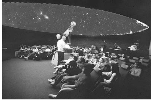
Плимутский планетарий. Урок ведёт директор планетария Рассел Блейк – один из руководителей программы народной дипломатии «Пипл ту пипл» («Люди к людям»).