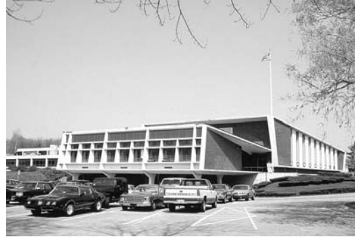
Плимут саус хай скул – Плимутская южная старшая школа, главный вход.

Значительная часть моего визита в США проходила в школах штата Массачусетс – в так называемых Хай Скул. Дословный перевод этого понятия на русский язык – «высокая школа» – не должен вводить в заблуждение уважаемого читателя. Это вовсе не учреждение высшего образования, а лишь последний этап среднего образования в США, длящийся с девятого по двенадцатый класс. Другими словами – старшая школа. Здесь ученики могут выбирать предметы достаточно свободно и для получения диплома должны выполнить лишь минимальные требования, которые устанавливает школьный совет. Вообще, структура образования США довольно сложна и запутана, здесь существуют школы разного уровня, программы определяются по-разному в каждом штате. Поэтому я не буду подробно освещать этот вопрос, а лишь поделюсь своими впечатлениями о посещении Плимут саус хай скул – Плимутской южной старшей школы.