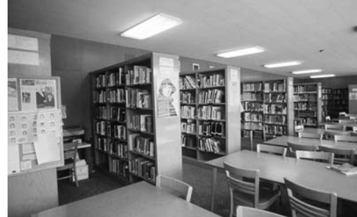
Библиотека Плимутской школы.